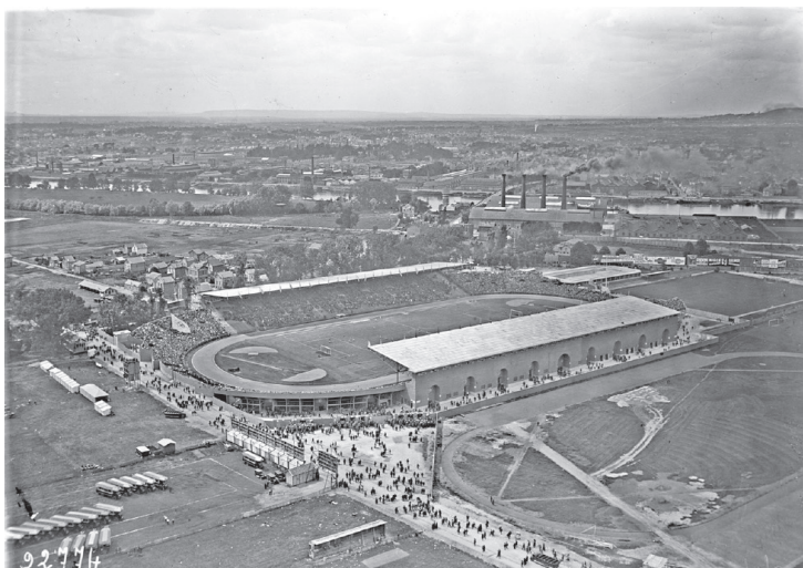
Site des Jeux olympiques 1924 et 2024: Stade olympique Yves-du-Manoir, Colombes.